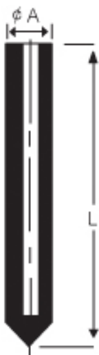
관련 부품 표준규격(mm)