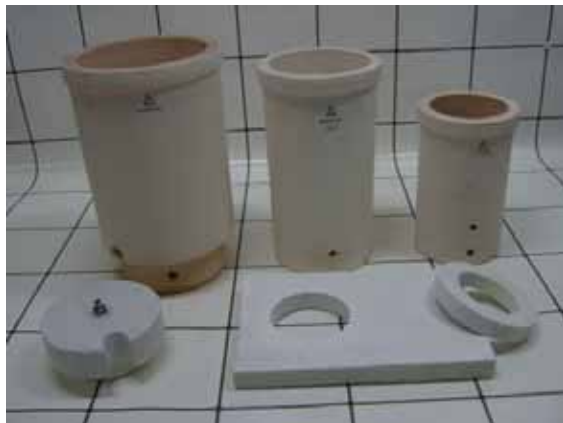
연속주조 다이 표준규격 (mm)