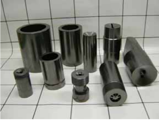
연속주조 도가니 표준규격 (mm)